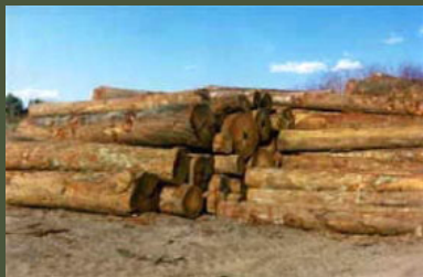
イタウバの原木です。