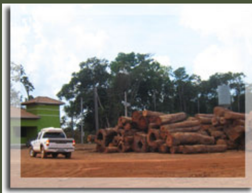
現地の製材風景です。この過程を経て日本に届きます。